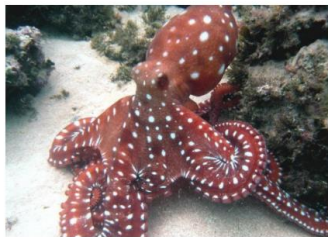
Mustekalan täplät pelottavat saalistajat karkuun.