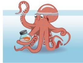
Frieda avaa ruokapurkkia.

Yhdysvalloissa eräässä merentutkimuskeskuksessa Squirt-niminen mustekala oppi maalaamaan. Se teki tämän liikuttelemalla vipuja, jotka suihkuttivat kankaalle maalia. Sitten tämä "taide" myytiin, ja näin saatiin rahaa mustekala-altaan ylläpitoon.