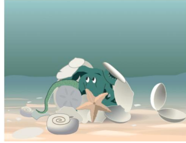
Simpukan- ja kotilonkuorien alle piiloutunut mustekala.

Mustekalat käyttävät kuoria joskus jopa piiloutumiseen. Ne tarttuvat kuoriin imukupeillaan. Sitten ne kietovat lonkeronsa ruumiinsa ympärille niin, että kuoret jäävät päällimmäisiksi. Ohi kulkevat saalistajat luulevat mustekalaa vain vanhaksi kuorikasaksi.