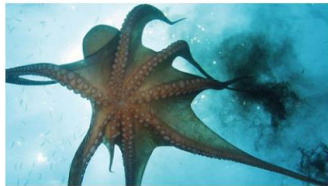
Mustekala suihkuttaa mustetta paetakseen vaaratilanteesta.