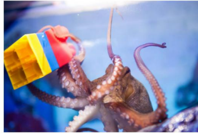
Altaassa lelulla leikkivä mustekala.

Eräässä yleisöakvaariossa Yhdysvalloissa Sammy-niminen mustekala nautti siitä, kun se sai leikkiä muovipallolla ja ruuvata sen kahta puoliskoa yhteen niin että niistä muodostui yksi pallo. Sammyn hoitaja pani pallon sisään ruokaa, ja Sammy aukaisi pallon ja ruuvasi sen taas kiinni, kun oli syönyt ruokansa.