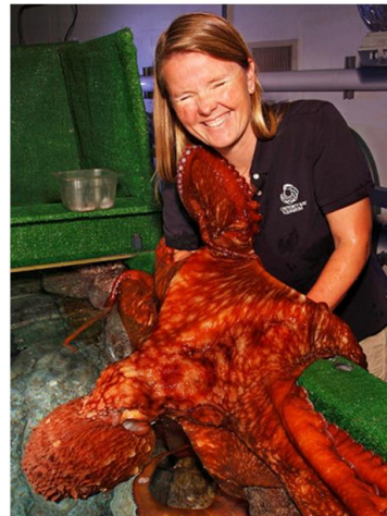
Mustekala tarrautuneena hoitajansa käsivarsiin.

Aivan yhtä paljon kuin mustekalat pitävät ruoasta ne pitävät myös seurasta. Kun mustekalat ovat syöneet, ne ojentavat yhden ja sitten toisen lonkeroistaan ja kietovat ne hoitajansa käsien ja käsivarsien ympärille. Mustekalat tarrautuvat hellästi hoitajiinsa imukupeillaan, ja mustekalat ja hoitajat halaavat toisiaan.