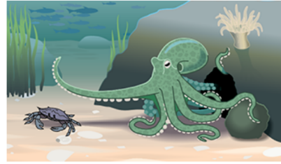
Mustekala pesänsä edustalla.

Mustekalat elävät usein yksikseen pesissä, jotka ne ovat rakentaneet kivistä. Toisinaan mustekalat tekevät itselleen kivistä jopa "oven", jolla ne voivat tukkia pääsyn pesäänsä ja suojella itseään.